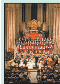
Après la cathédrale (photo), au tour de l'église de Chippis.